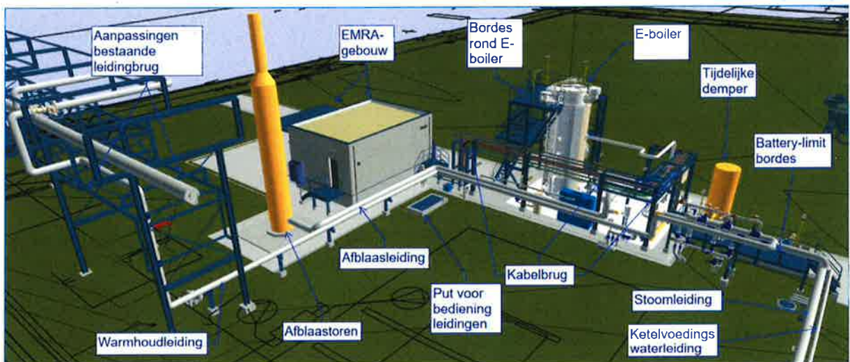
Afbeelding 2 overzicht bouwwerken, (afbeelding afkomstig van het document 'Sterkte- en stabiliteitsberekening met kenmerk: nIT57143 1334101, d.d. 4 juli 2024)